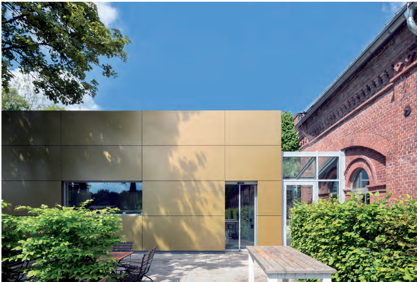
> Küche mit Biergarten und Anschluss zum Bestand